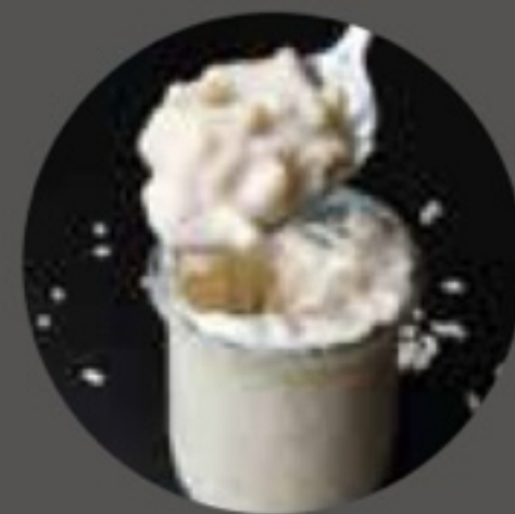
Riz au lait