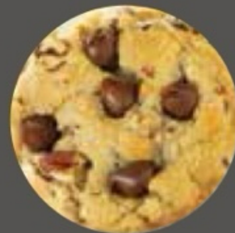
Cookie pépites de chocolat*