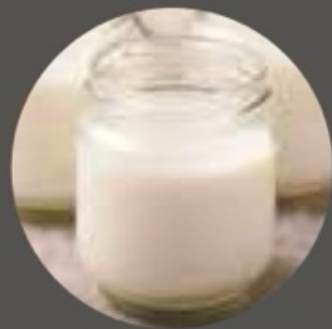
Fromage blanc nature